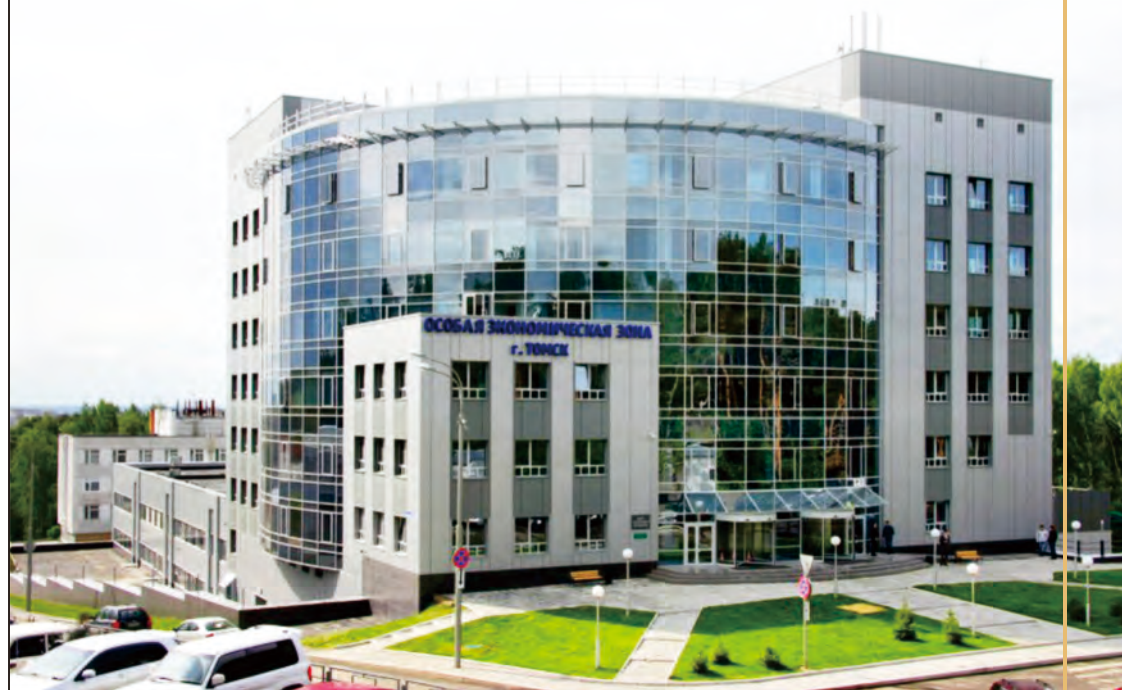
俄羅斯國家研究型大學—國立托木斯克理工大學 National Research Tomsk Polytechnic University