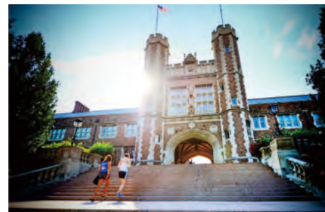
美國聖路易市華盛頓大學