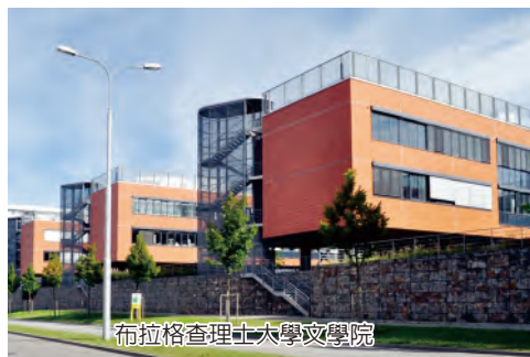
布拉格查理士大學文學院