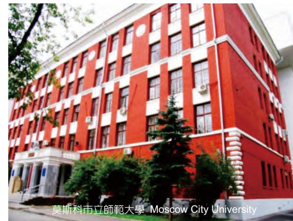
莫斯科市立師範大學 Moscow City University