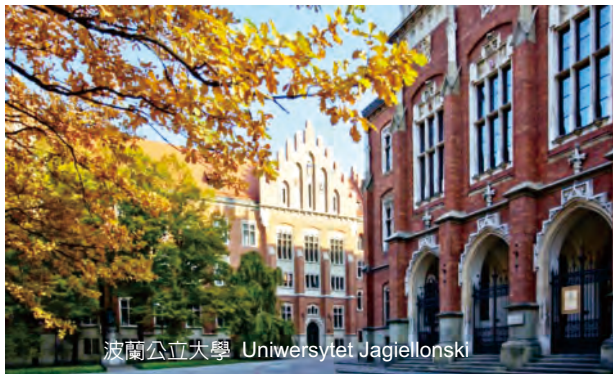
波蘭公立大學 Uniwersytet Jagiellonski