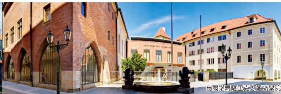
布爾諾馬薩里克大學文學院