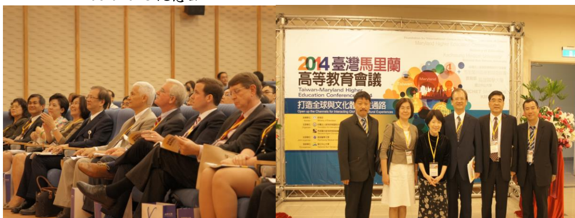
會場貴賓聆聽致詞