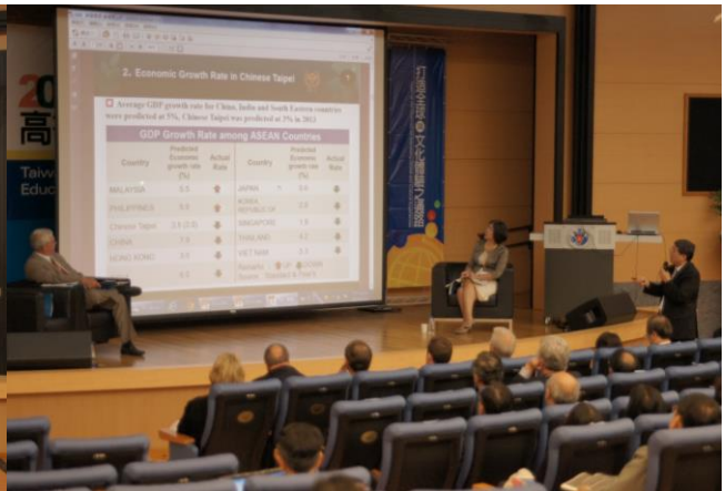
場次 2: 跨國教育/實習成功模式