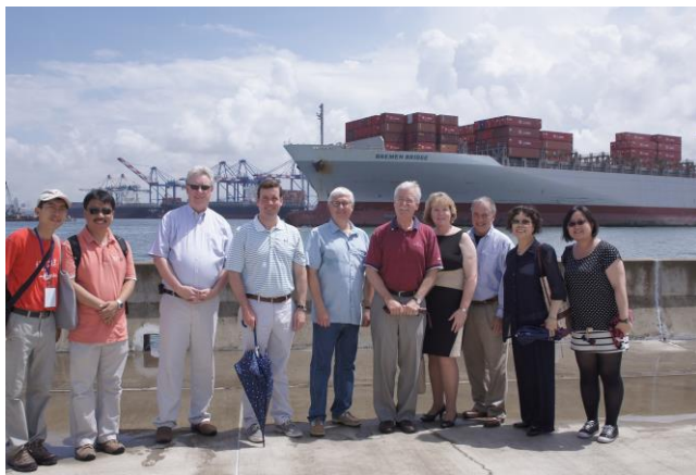
馬方代表參訪高雄紅毛港文化園區