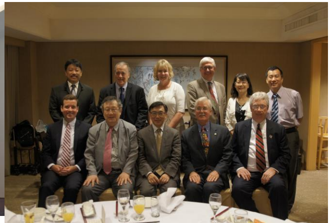
高雄醫學大學歡送晚宴