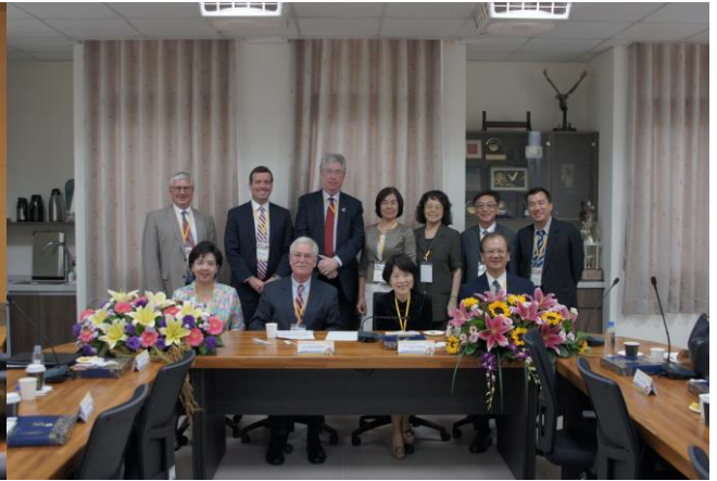
中午午餐會議與會人員合影