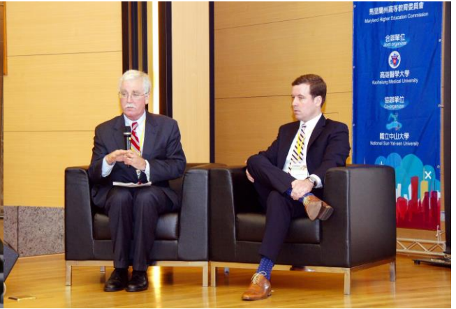
馬里蘭高等教育介紹