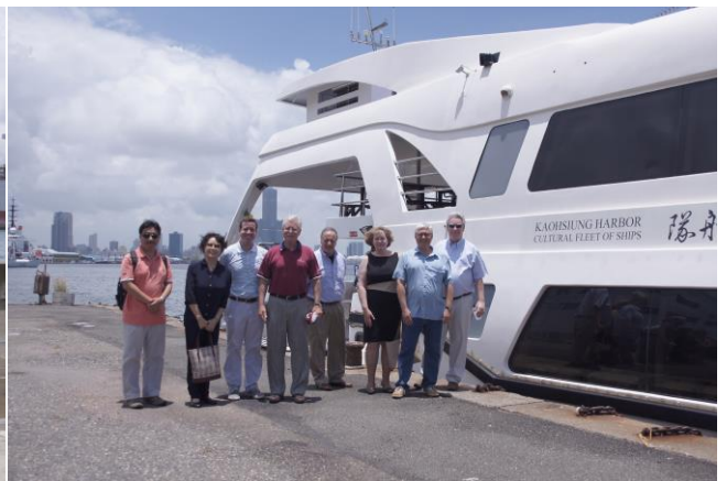
馬方代表搭乘高雄港觀光遊艇