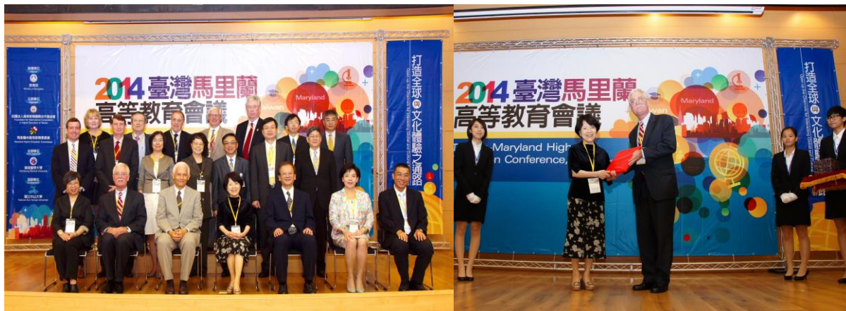
致詞貴賓與臺馬與談人及相關單位代表 紀念合影