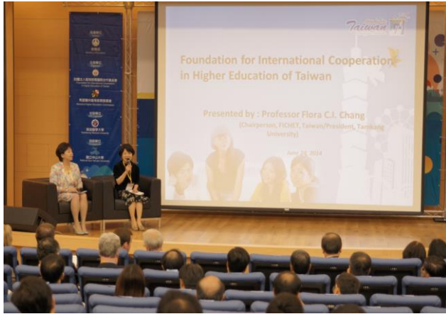
臺灣高等教育介紹