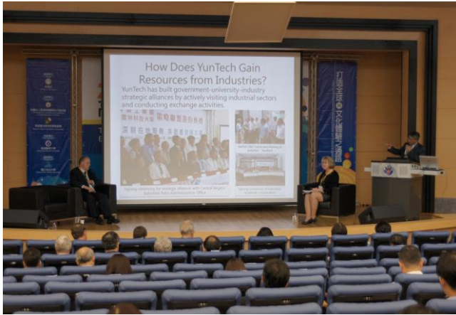
場次 3:大學生的創意及創業學習