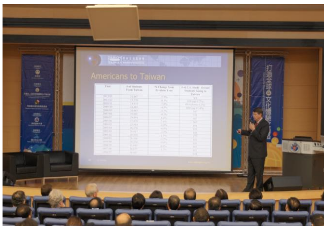
專題演講1: 提升美國在台學生數之挑戰及機會