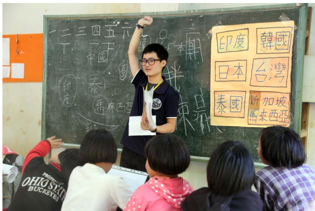
〈進行亞洲文化教學，使學童更了解周遭國家文化〉