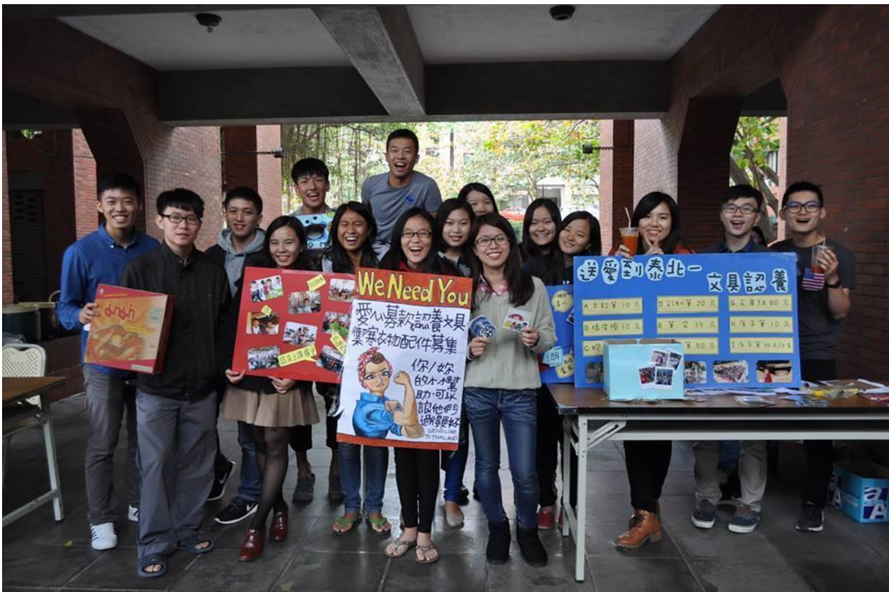
〈泰北周擺攤活動照片〉