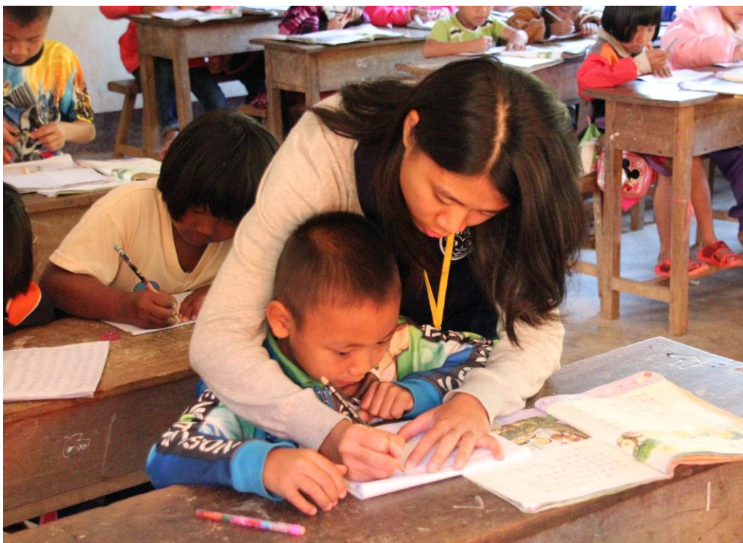
〈團員細心輔導學童〉