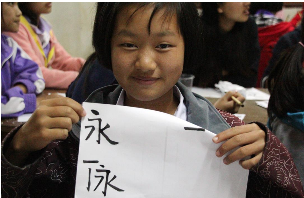
〈透過書法教學，傳遞中華文化〉