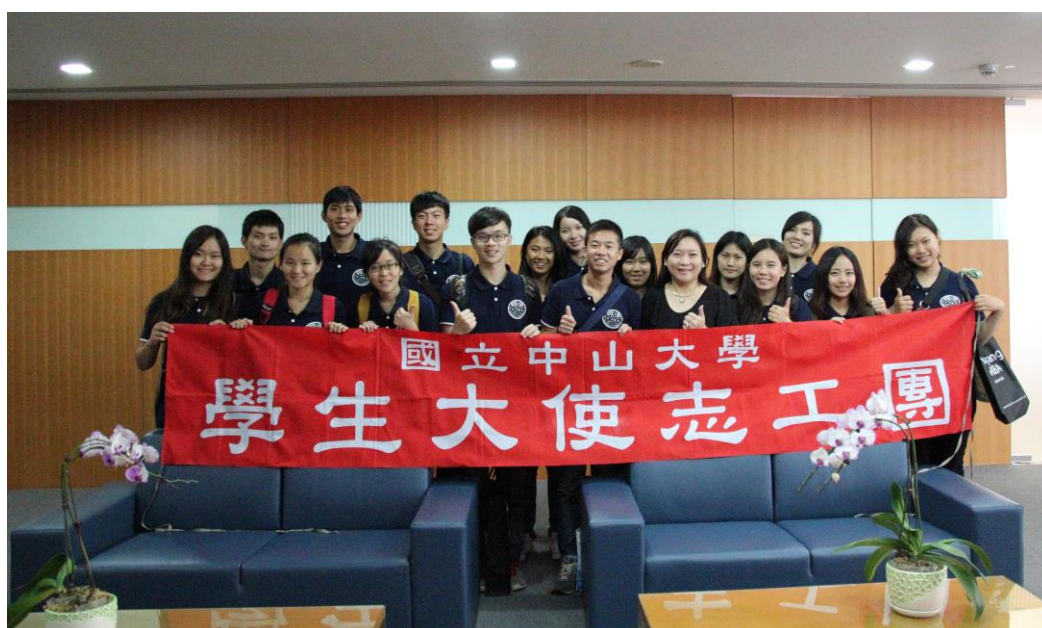
〈與新加坡南洋理工大學管理學院代表合影〉