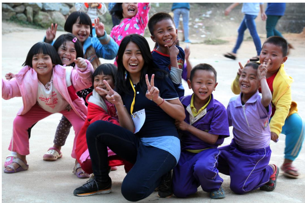
〈團員與學童感情融洽〉