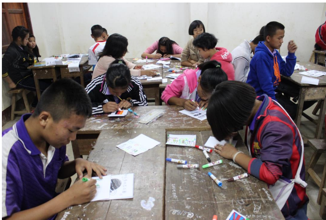
〈透過文化小書製作，學童們能對各國文化加深印象〉