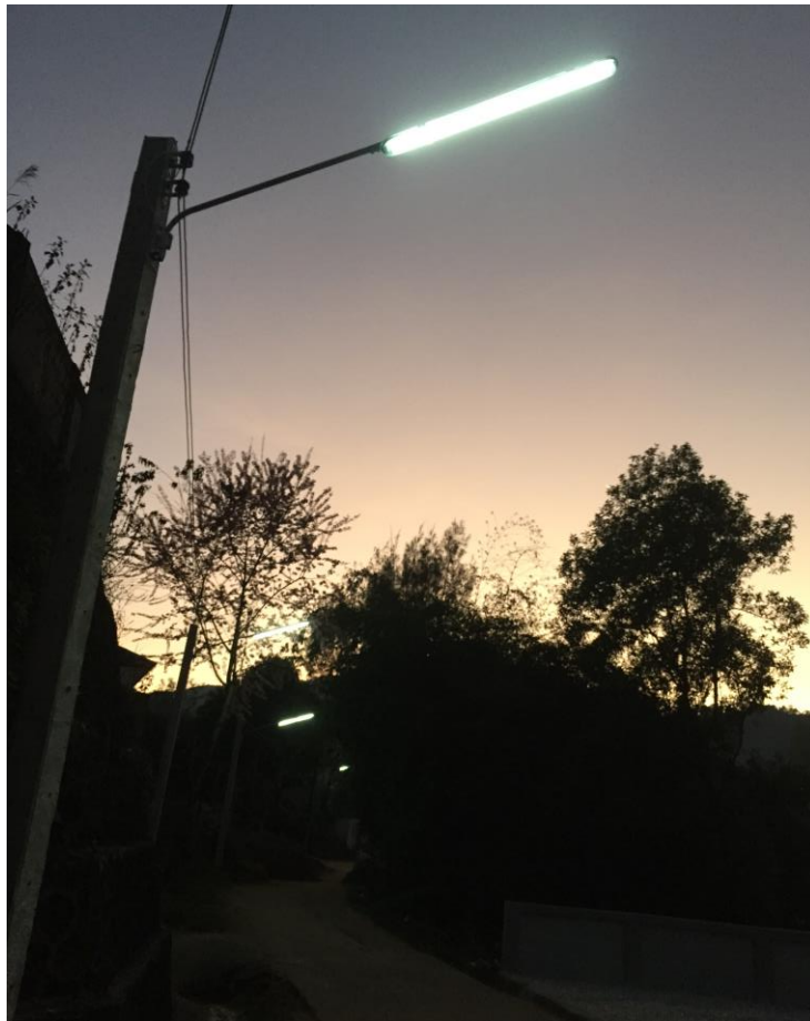
〈嶄新的路燈照亮學童回家的路〉