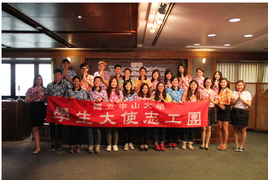
〈曼谷大學參訪活動合影〉