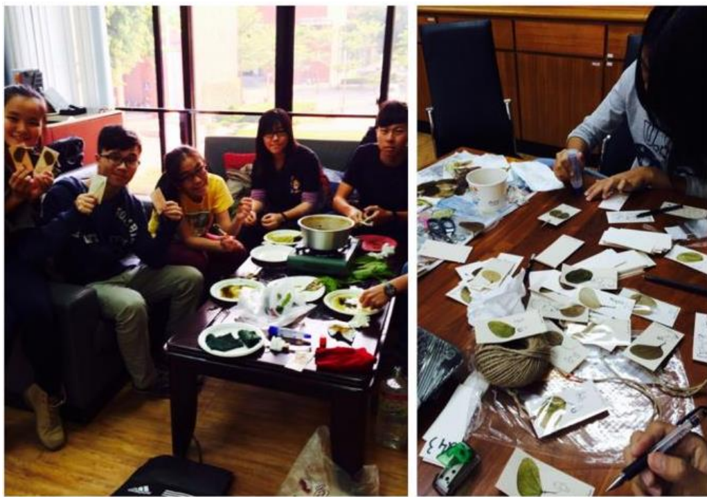
〈團員齊聚為了泰北周準備〉