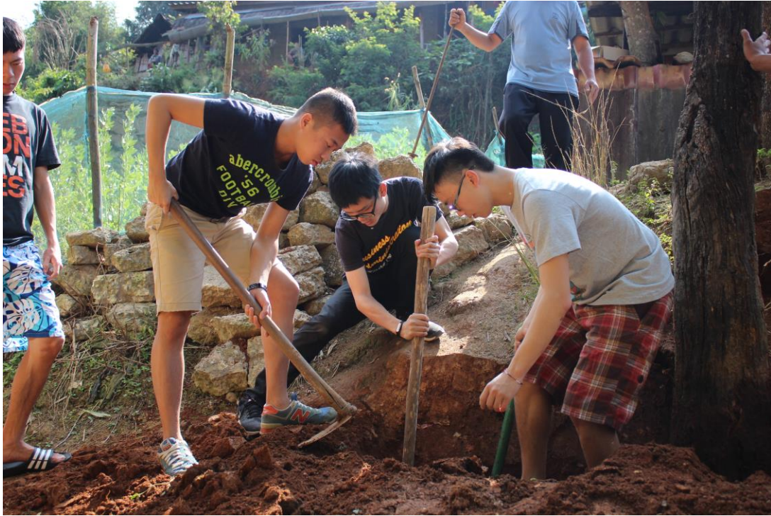
〈團員齊力修建路燈〉