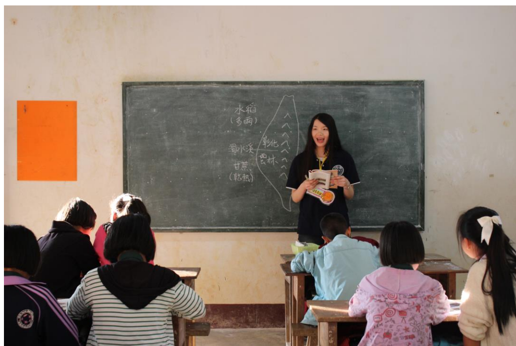
〈台灣文化教學，使學童更了解我們的文化〉