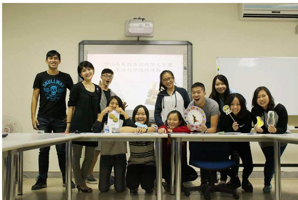
〈於華語教學中心進行培訓課程〉