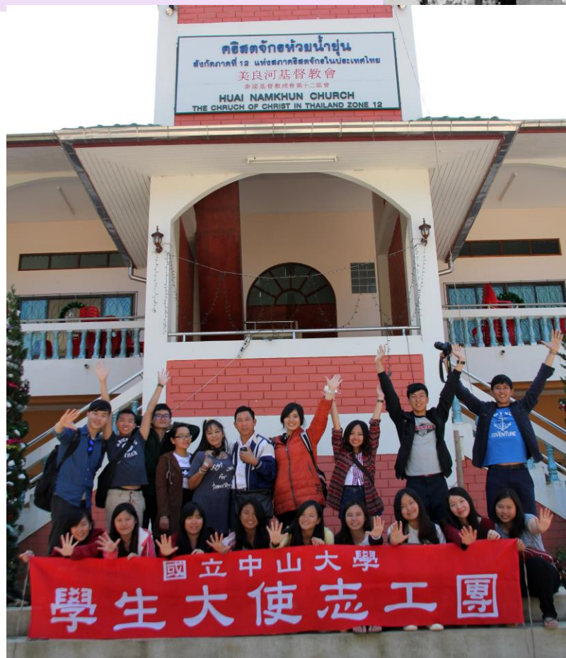
〈與明朗中學校長一家人合照〉