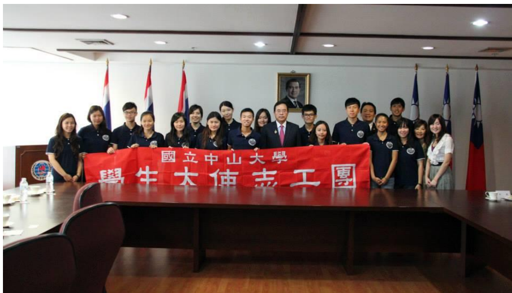
〈與駐泰國台北經濟文化辦事處處會見陳大使銘政〉