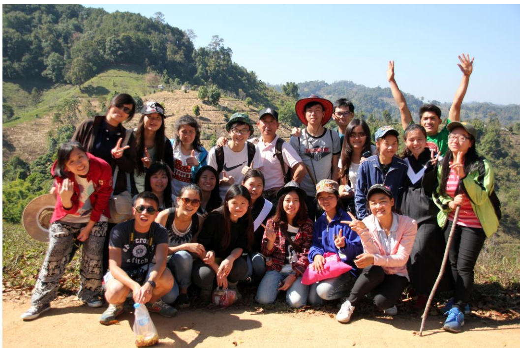
〈與明朗村學生合照〉