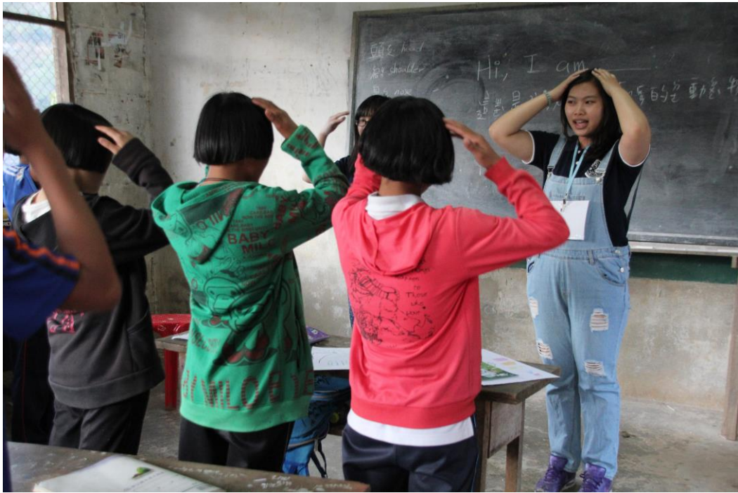
〈透過課堂活動方式進行教學〉