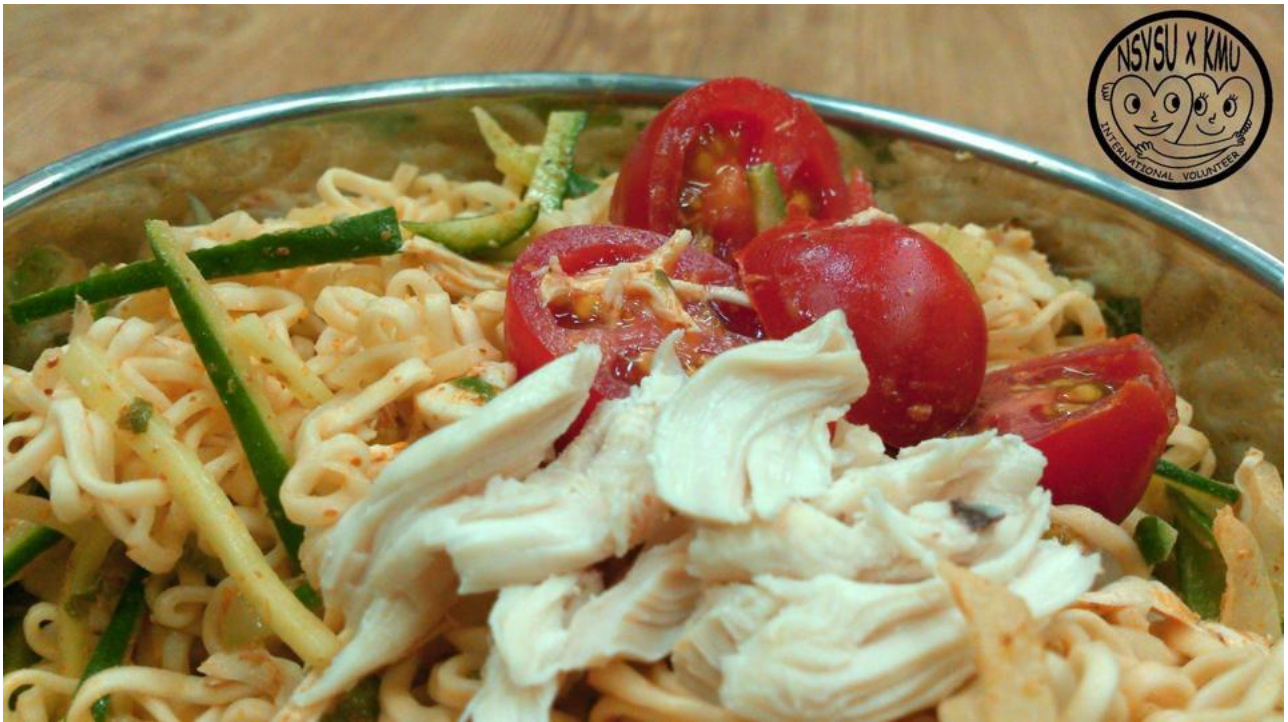
〈泰式拌麵成果展現〉