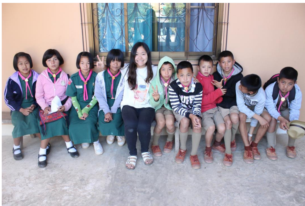
〈團員與學童和樂融融合照〉