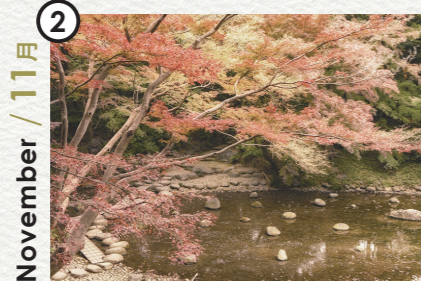
Autumn foliage [ Koishikawa Korakuen Gardens ] 秋の紅葉 [ 小石川後楽園 ]