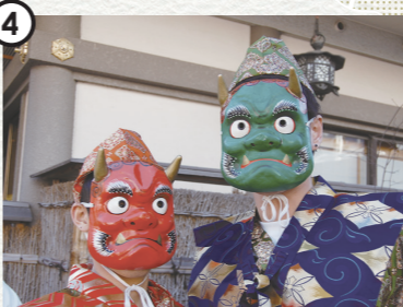
Setsubun Festival [ Yushima-Tenjin Shrine ] 節分祭 [ 湯島天満宮 ]