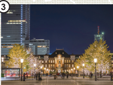
Winter illuminations [ Marunouchi, Tokyo and other areas ] 冬のイルミネーション [ 丸の内など ]