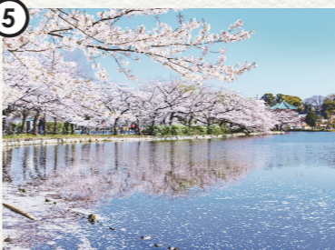
Ueno Cherry Blossom Festival [ Ueno Park ] うえの桜まつり [ 上野恩賜公園 ]