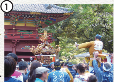
Nezu Shrine Annual Grand Festival [ Nezu Shrine ] 根津神社例大祭 [ 根津神社 ]