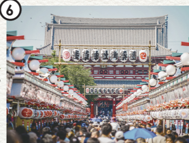
Sanja Matsuri (Sanja Festival) [ Asakusa Shrine ] 浅草神社例大祭「三社祭」 [ 浅草神社 ]