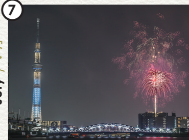
Sumida River Fireworks Festival [ Banks of the Sumida River ] 隅田川花火大会 [ 隅田川沿い ]